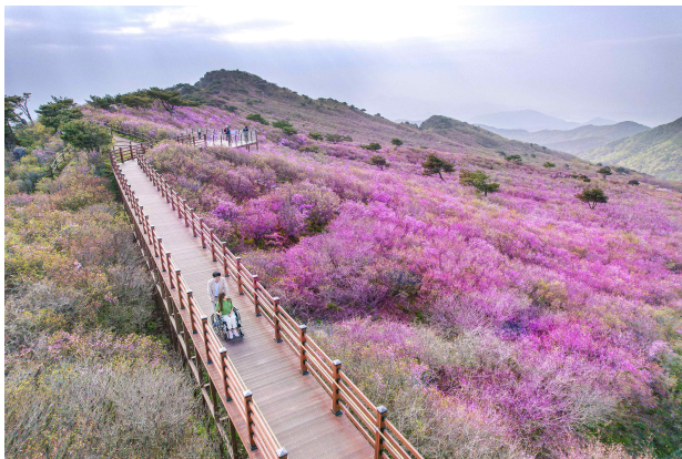
대구 비슬산 군립공원