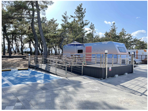
강릉 연곡해변 캠핑장 (유니버설디자인카라반)