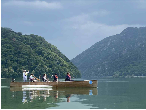
춘천 의암호 킹카누