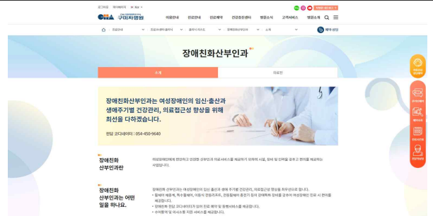
구미차병원 장애친화 산부인과 웹페이지